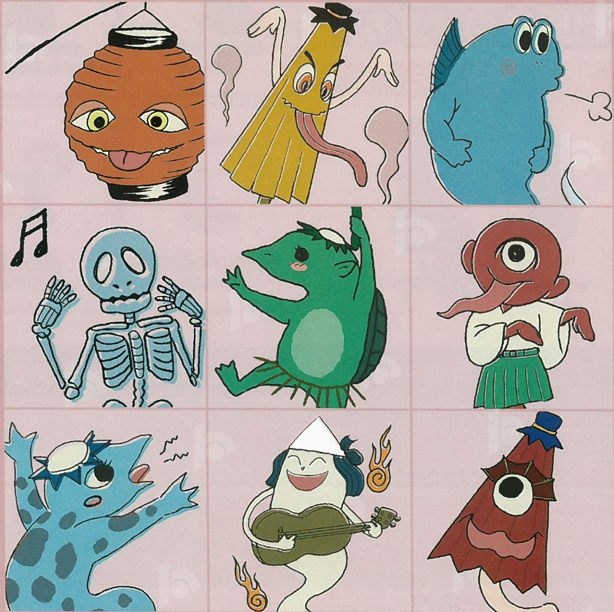
イラスト：三次の烏天狗